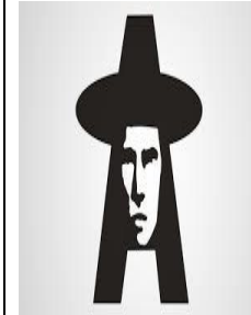
EN YOU TUBE: VICTOR HEREDIA - MUERTE DE TUPAC AMARU