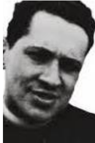
EN YOU TUBE: VÍCTOR JARA "CAMILO TORRES" RESTREPO