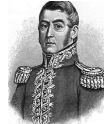
EN YOU TUBE: CANCIÓN AL GRAN JOSÉ DE SAN MARTÍN