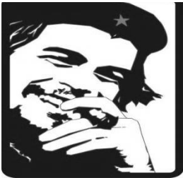
EN YOU TUBE: VICTOR JARA CHE GUEVARA