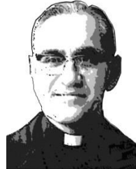
EN YOU TUBE: CANCIÓN PARA UN MÁRTIR - MONSEÑOR ROMERO