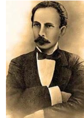
EN YOU TUBE: HOMAJE A JOSE MARTI. POLO MONTAÑEZ