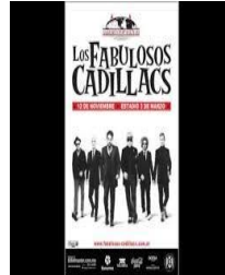
EN YOU TUBE: LOS FABULOSOS CADILLACS - EL LEÓN MANUEL SANTILLAN