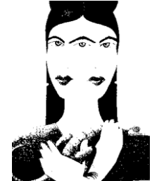
EN YOU TUBE: LA MALDICIÓN DE MALINCHE - CONQUISTA DE MÉXICO