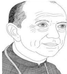
EN YOU TUBE: MEDITACIÓN SOBRE PUEBLA A HELDER CAMARA CARLOS BENAVIDES