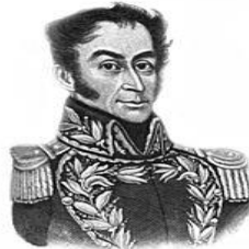
EN YOU TUBE: UN CANTO A LA REVOLUCIÓN - ALI PRIMERA