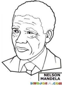
EN YOU TUBE: PABLO MILANÉS - NELSON MANDELA