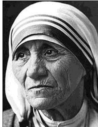
EN YOU TUBE: CANCIÓN A LA MADRE TERESA DE CALCUTA. DAME ALMAS, SÉ MI LUZ.