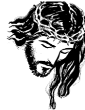
EN YOU TUBE: JESUCRISTO- VERDADERO DIOS Y VERDADERO HOMBRE - CANCIÓN: HISTORIA DE UN CARPINTERO