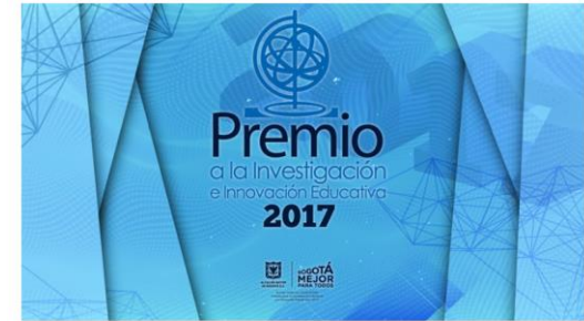
Colegio Fernando Mazuera